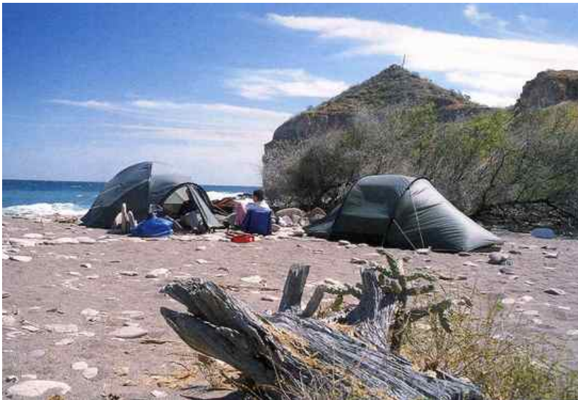
Windgeschützte Übernachtungsplätze sind rar.