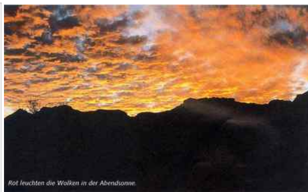
Rot leuchten die Wolken in der Abendsonne.

Eine herrliche sandige Bucht auf Isla Carmen ist leider von einer größeren Gruppe eingenommen worden. Offene Zelte und Sonnensegelleuchten uns schon von weitem entgegen, aber auch wir finden etwas weiter nördlich einen Strand für uns alleine. Große Säulenkakteen umranden die Bucht, umschwirrt von Kolibris. Erschöpft und durchgeschwitzt flüchten wir in den kargen Schatten, noch haben wir uns nicht an die Temperaturen gewöhnt. Beim Zeltaufbau sind wir immer vorsichtig und räumen mit Lederhandschuhen