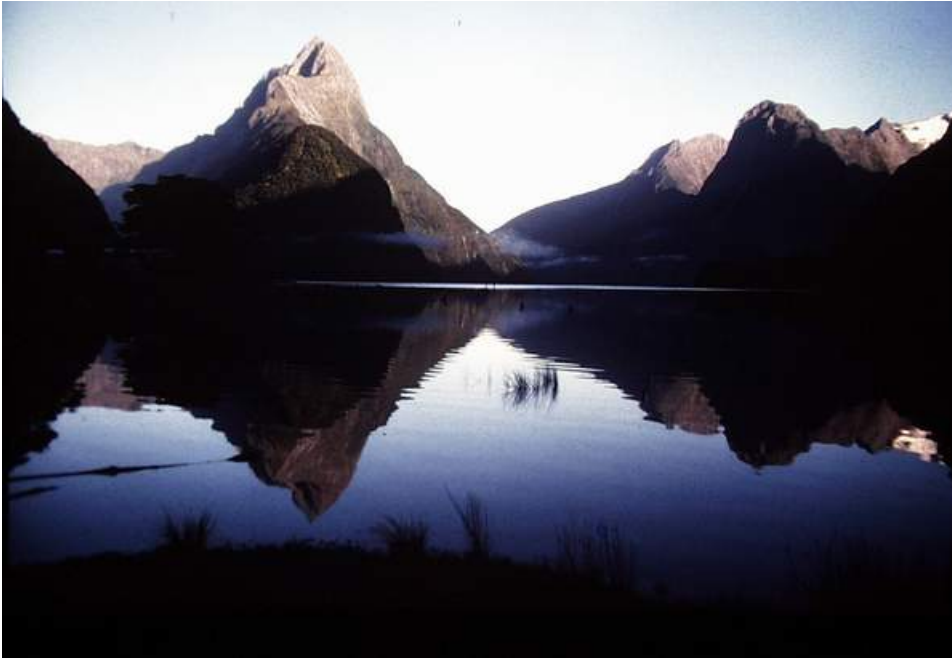
1995 zusammengestellt, letzte Besuche datiert von Frühjahr 2000 & Nov./Dez. 2005