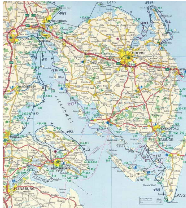
1981 - Kleiner Belt: Vejle - Kolding