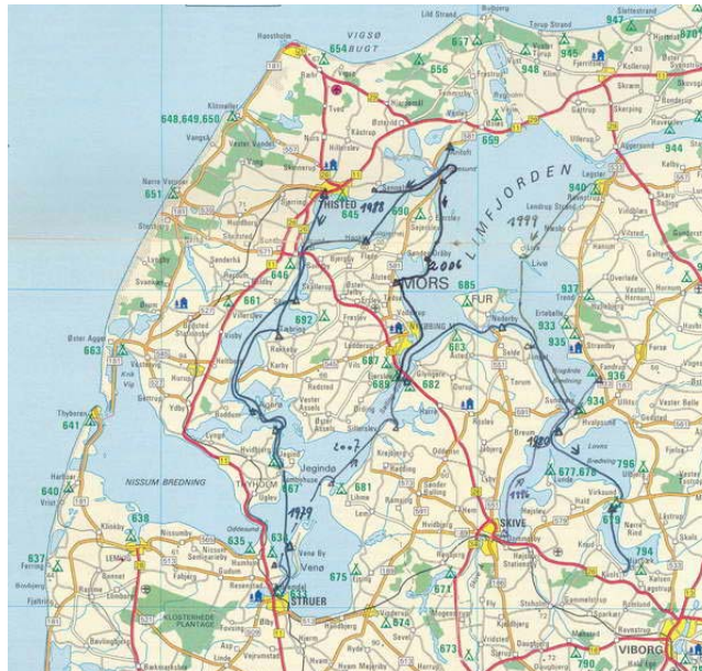
1979 - Limfjord: Thisted - Struer