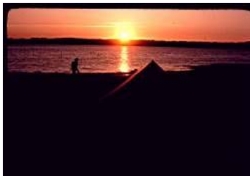
1980 - Limfjord: Sallingsund - Kvols (Glyngöre - Hjarbaek)