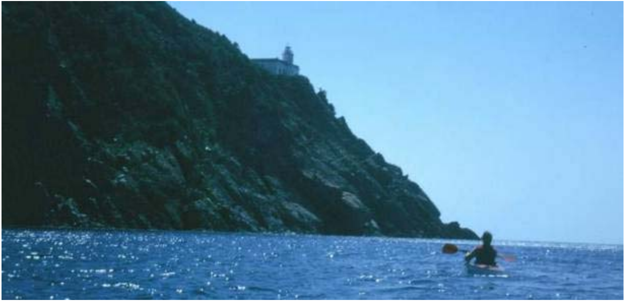
Der Leuchtturm Polverala an der Nordwestecke Elbas

Von nun an war an eine Pause nicht mehr zu denken. Böen treffen uns glücklicherweise überwiegend von vorn. Aber die Küste lässt auch keinen Raum zum Anlanden, um dem Wind auszuweichen; wir müssen durch. Vor den kleinen Kaps kommen die Wellen aus allen Richtungen, es ist für Stunden eine elende Hoppelei, die konzentriertes Fahren verlangt.