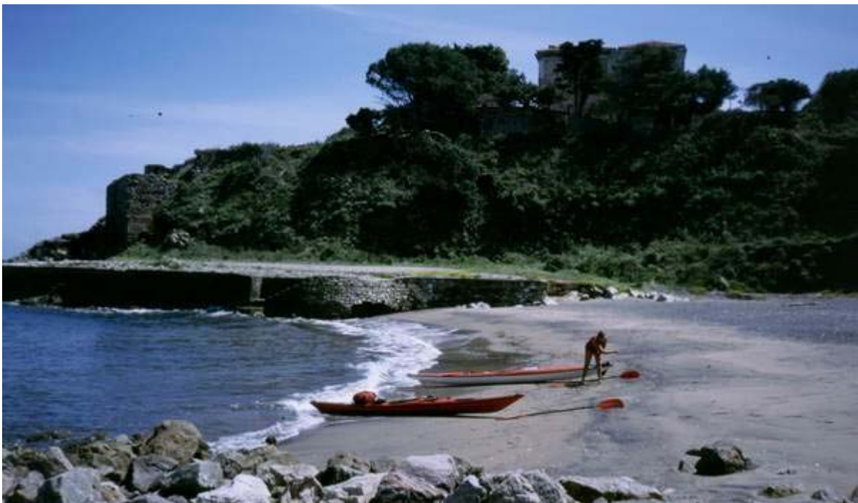
Am Capo Vita

Während also Port Azurro vergleichsweise hektisch, Rio Marina schon wesentlich relaxter ist, macht Cavo einen recht verträumten Eindruck. In Cavo kann ich das Restaurant Hemmingway empfehlen; liegt am südlichen Rand des Ortes etwas oberhalb der Hafenmole. Sicher nicht einfach die italienische Speisekarte zu entziffern, denn alles Bekannte von unseren deutschen Italienern und deren Speisekarten wird man vergeblich suchen, dagegen scheinen die Speisen des Hemmingway-Menüs auch recht literarisch wertvoll beschrieben zu sein. Aber da die Wirtsleute selbst auch nur Italienisch kommunizieren, ist die Bestellung ein Lotteriespiel – aber uns schien es als hätten wir den Hauptgewinn gezogen.