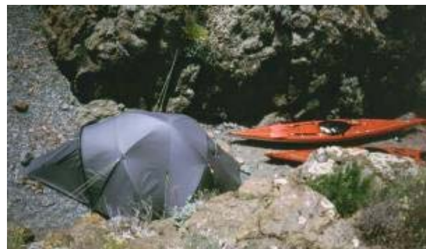
Unser Minstrand in der Bucht von Acquarilli