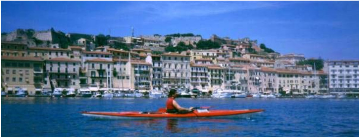
Vor der Altstadt von Portoferraio

Wir sind in netto 5 Paddeltagen gegen den Uhrzeigersinn um die Insel gefahren und fast in jeder Dorf- oder Stadtbucht angelandet, wenn dort ein Cafe oder ähnliches zu sehen war - ein Vino oder Cappuchino ist nie zu verachten. Die Überquerung der Bucht von Portoferraio auf direktem Wege ist eine Herausforderung, man wird leicht zum vermeintlichen Jagdziel der Fähren und Schnellfähren: zwei Fährlinien machen sich da Konkurrenz und mächtig Verkehr.