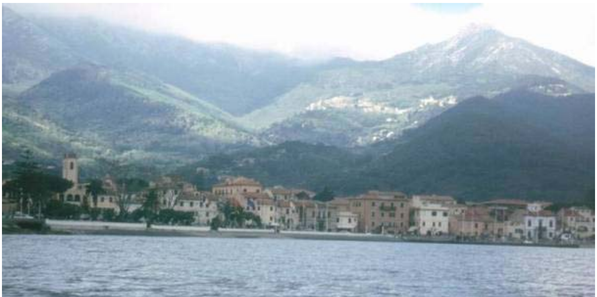
Marciana Marina am Campo Nell'Elba und an der Bergflanke der Ort Marciana

Danach wird es gemütlich, das Wasser ist ruhig und es paddelt sich angenehm. In der Bucht von Procchio – konkret etwas westlich von Scaglieri im Golfo Biodola in der Bucht Porticciolo - finden wir einen Platz für unser Zelt an einer kleinen Flussmündung, die Brandung hat dort eine dicke Röhrichtschicht auf dem Strand aufgeworfen – ein weiches Lager ist uns sicher.